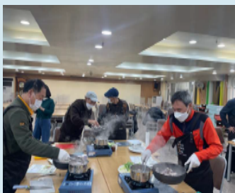
요리보고(단체 관 내 요리활동)

성가정노인종합복지관의 사례는 사회적 고립이 관리의 대상이 아니라, 관계 회복을 통해 예방해야 할 문제임을 보여준다. 서울형 사회적 고립 예방 정책은 개인의 관리가 아니라, 일상 속에서 관계가 다시 만들어지는 지점에서 시작되어야 함을 분명히 한다. 이 사례는 노인복지관이 서비스 제공을 넘어, 지역 안에서 관계가 지속되도록 설계하고 연결하는 핵심 거점이 될 수 있음을 보여준다.