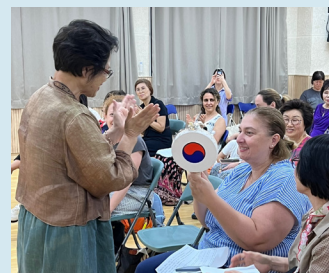
문화 알림 활동 사진