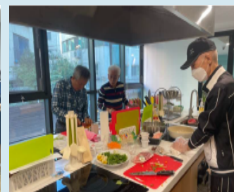
1인가구 지원센터 연계(공유주방) 활동