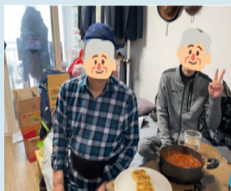
조리보고(2인 1조 가정 내 요리활동)